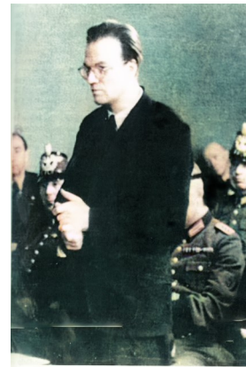
Alfred Delp vor dem Volksgerichtshof