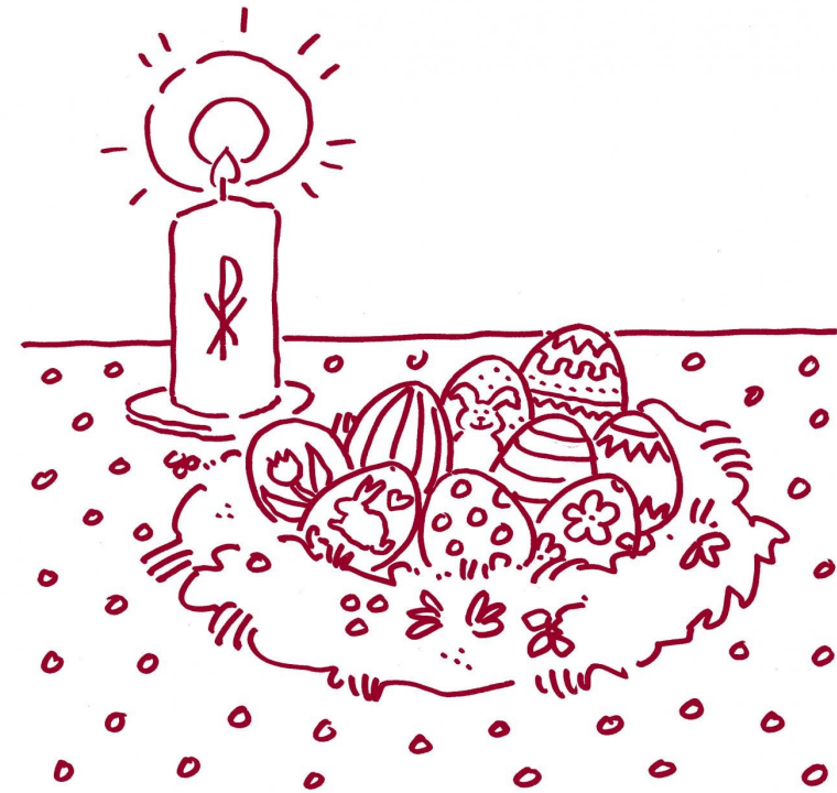
Der Bibel-Kalender für Sonntagsmaler 2013 ISBN 978-3-7462-3270-6, € 7,95, St. Benno-Verlag, www.st-benno.de