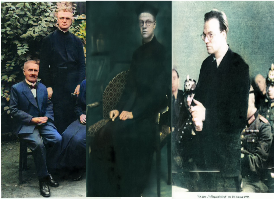
Primiz, mit Eltern